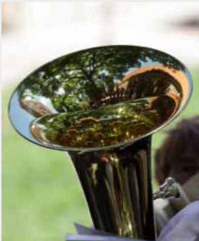
Sankt Petri im Spiegel einer Posaune

können im Kirchenbüro gebucht werden (Tel.: 33 13 38 33 und m. 23 29 50 01)