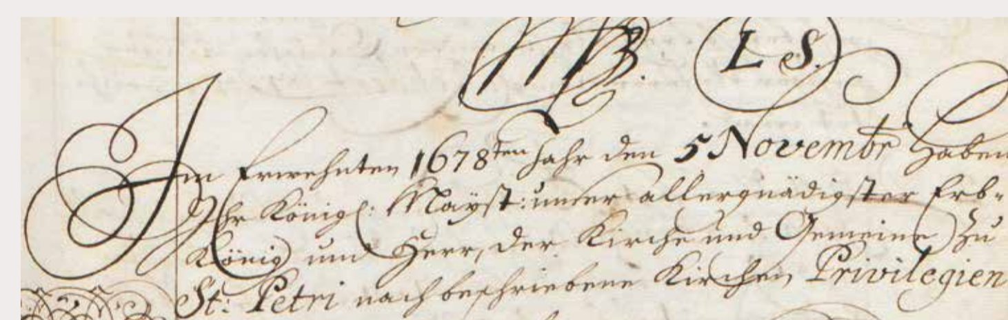
5. November 1678: Christian V. bestätigt und erweitert die Privilegien der Gemeinde · 5 November 1678: Christian V confirms and expands the congregation's privileges