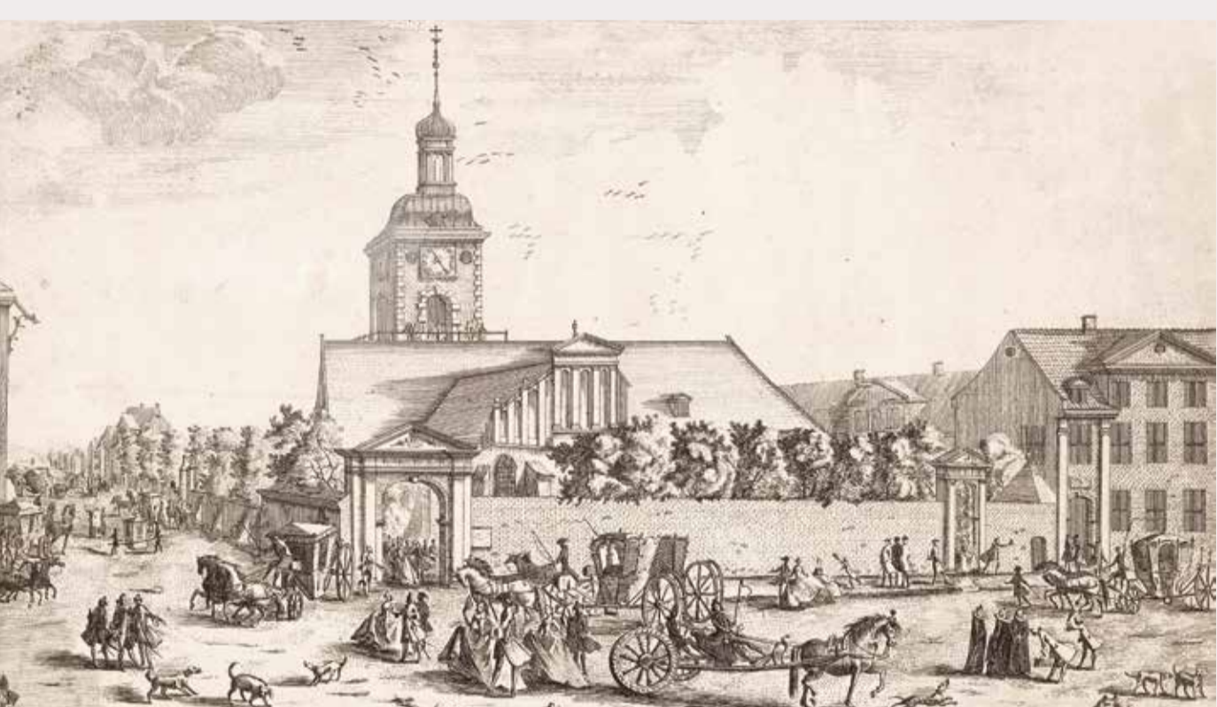
Sankt Petri 1746 (Laurids de Thurah)