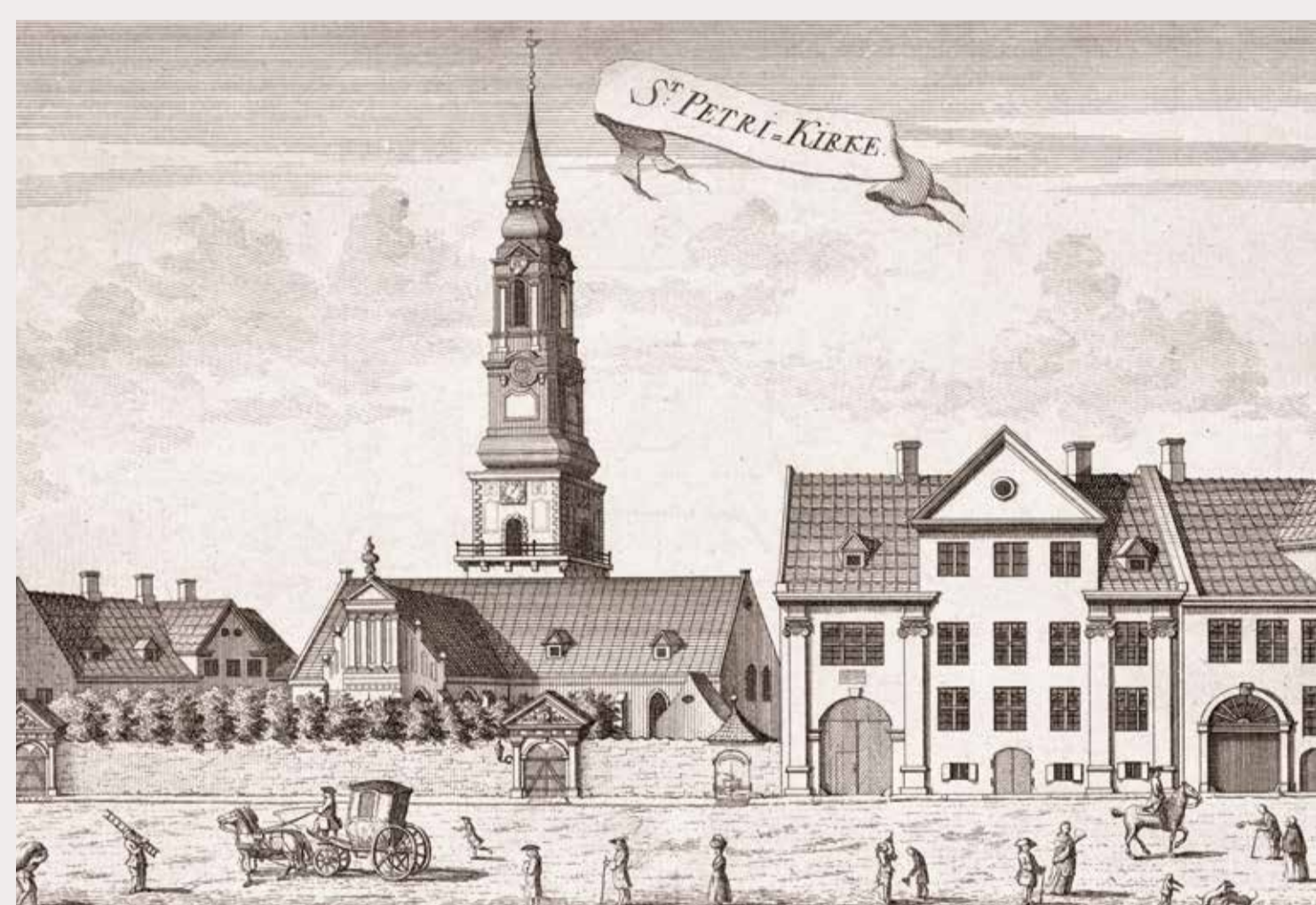
Sankt Petri 1763 (Hans Qvist)

Der ursprüngliche Kirchturm wird beim großen Brand von Kopenhagen 1728 völlig zerstört. Kurz danach baut der Architekt Cai Dose einen neuen Turm mit Kuppel. 1757 wird mit Hilfe einer Spende von Frederik V. ein neuer kupfergedeckter Barockturm von Baumeister Boye Junge erbaut. Er wird zu einem Wahrzeichen der Hauptstadt.